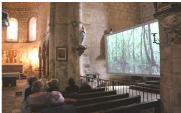
La vidéo Nostalgia de Julie Chaffort

Gratuit et ouvert à tous les publics pendant trois semaines ils furent nombreux les habitants, les amateurs d'art, les touristes, les pèlerins mais aussi les élèves des écoles, collèges et lycée à profiter de ce parcours pour admirer ces créations contemporaines dans des sites remarquables.