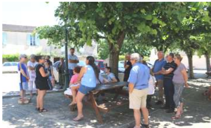
Visite insolite de l'église avec la guide de Pass'enGers