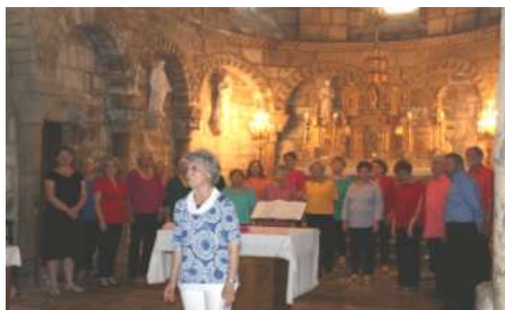
La chorale La Part des Anges