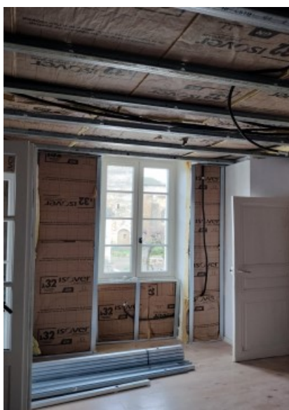
Isolation des murs et du plafond