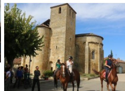
Le petit marché, les concerts et les cavaliers de Condom